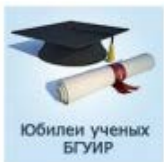
Юбилей ученых БГУИР