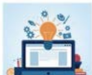
Электронный ресурс по учебной дисциплине (ЭРУД)