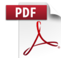
Положение о конкурсе Влюбленные в Петербург.pdf