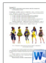
Форма и орнаментальные мотивы.docx