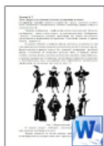
Форма в композиции костюма.docx