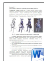
Форма и тональные отношения в композици...