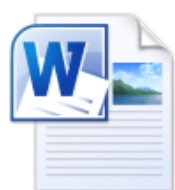
Конференции и Выставки 2021-22.docx