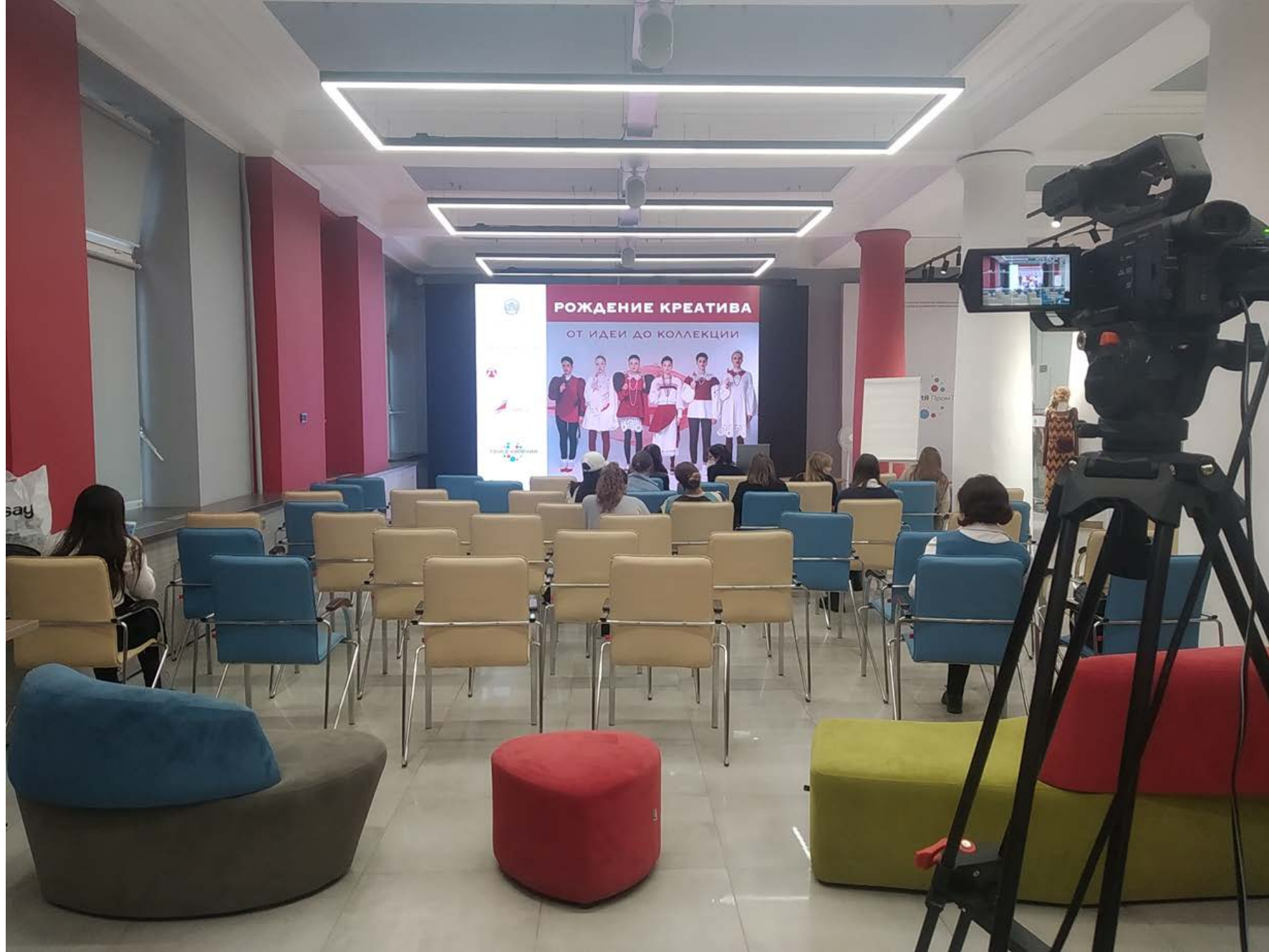
КОНФЕРЕНЦЗАЛ «ТОЧКА КИПЕНИЯ»