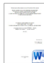
Основы Композиции Костюма часть 2.doc