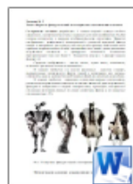
Форма и фактура.docx